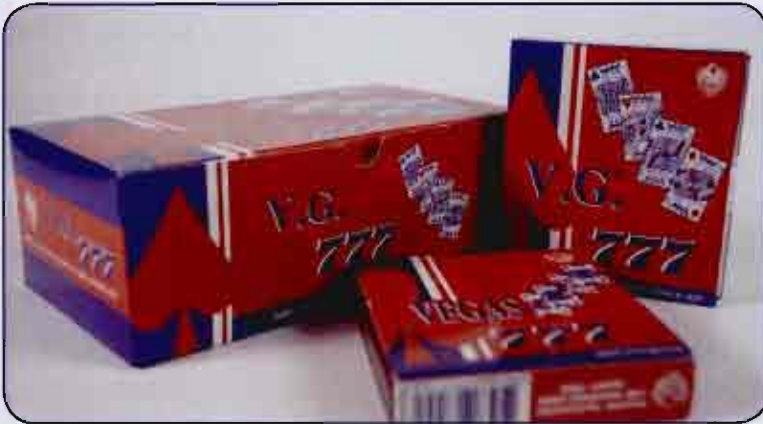
ไพ่โป๊กเกอร์สี ชื่อ VEGAS รุ่น V.G. 777