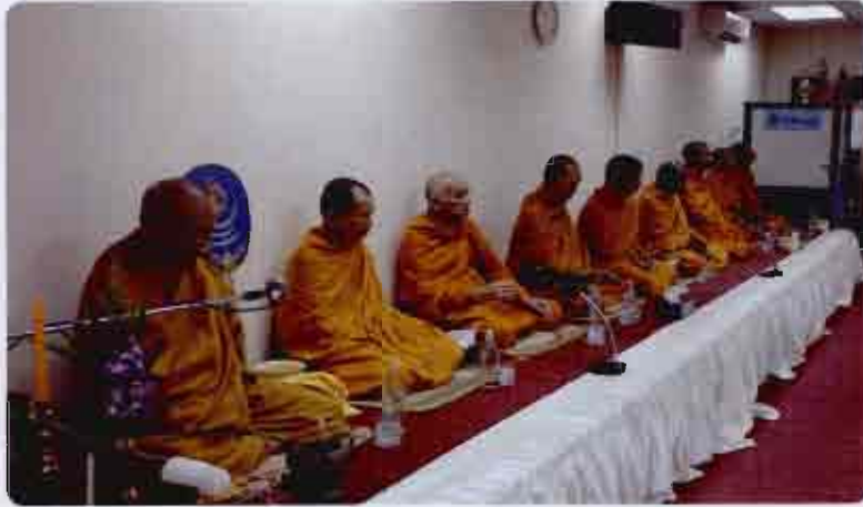
โรงงานไฟ จัดกิจกรรมครบรอบ วันสถาปนา ปีที่ 73 เมื่อวันศุกร์ที่ 29 มิถุนายน 2555