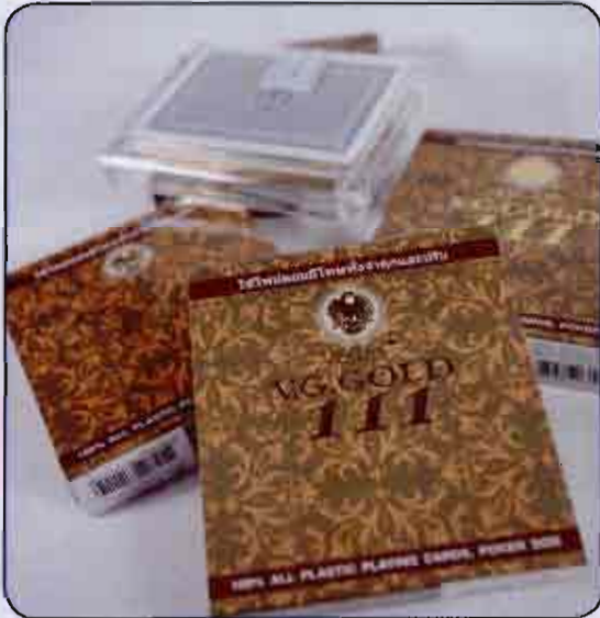
ไพ่โป๊กเกอร์พลาสติกขอบทอง ยี่ห้อ VEGAS รุ่น V.G. GOLD III