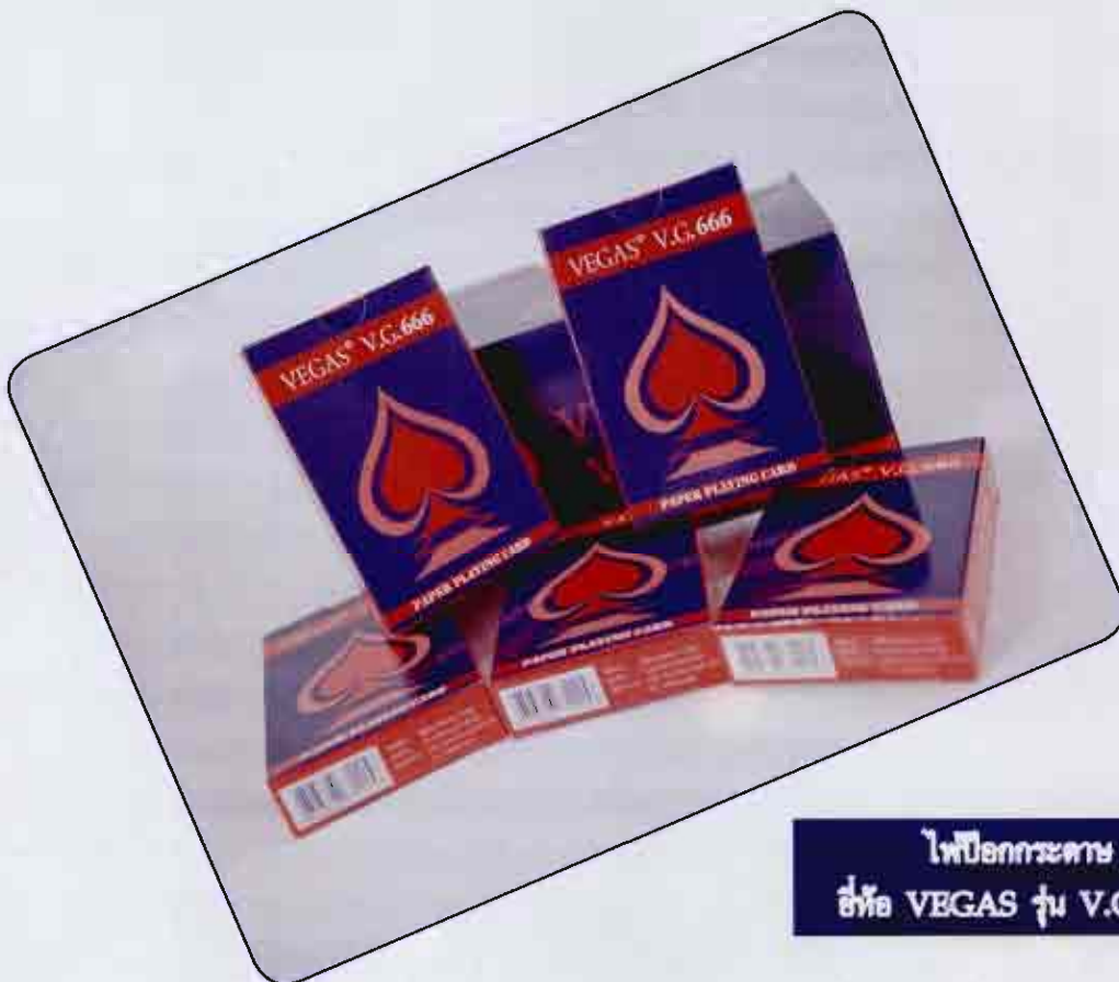
ไพ่โป๊กเกอร์ตา ชื่อ VEGAS รุ่น V.G. 666