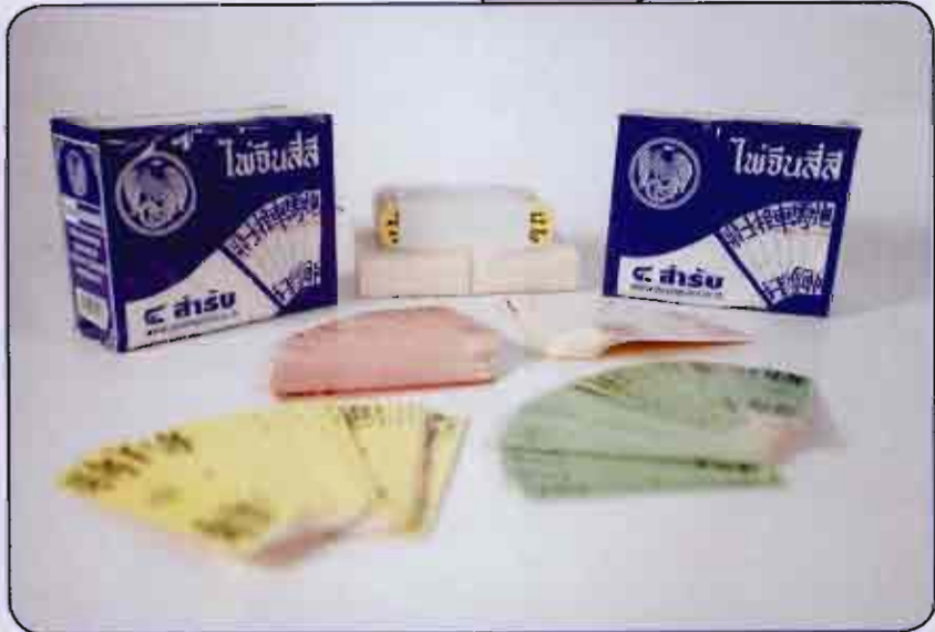
ไฟจีนลีส