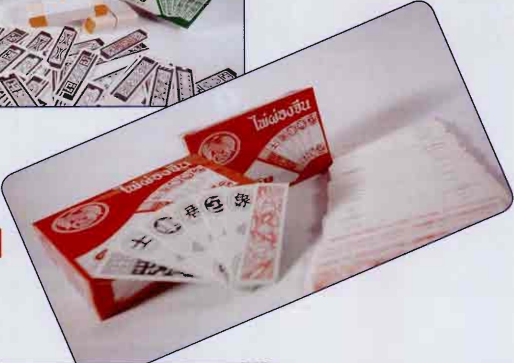
ไฟผองจีน